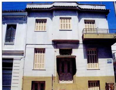
6-8. Μεσοπολεμικές οικίες στην οδό Τριών.

Όσον αφορά στην αξιολόγηση της συνοικίας των Άνω Πετραλώνων, από τους τρεις ευδιά-