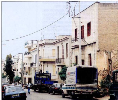
5. Σειρά μεσοπολεμικών κτιρίων στην οδό Τριών.

κής που σπανίζει εδώ είναι τα έρκερ, προφανώς γιατί το μικρό ύψος των κτιρίων δεν έκανε δόκιμη την εφαρμογή τους, αλλά και γιατί η μικρή επιφάνεια των ορόφων δεν επέτρεπε την ύπαρξη των μεγάλων δωμάτων των μεγαλοαστικών κατοικιών όπου συνηθώς εμφανίζονται αυτές οι κλειστάς προσεχές. Παρά, όμως, την απλότητά τους, και αυτά τα κτίρια αποτελούν πολύτιμες μαρτυρίες του τρόπου με τον οποίο το μοντέρνο κίνημα εισέδυσσε και εδραιώθηκε στην πάνδημη αρχιτεκτονική, προσαρμοζόμενο πάντοτε στις τοπικές ανάγκες και δυνατότητες. Οι δύο παραπάνω τύποι κυριαρχούν στον δεύτερο τομέα, ενώ αποτελούν πολύ μικρό ποσοστό των κτιρίων του πρώτου τομέα.