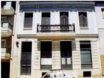
3-4. Κτίρια του όψιμου κλασικισμού στην οδό Τρωών.

Ακολούθει χρονολογικά ο τύπος του –λαϊκού κυρίως– μεσοπολεμικού σπιτιού, που αντιπροσωπεύεται από μονώροφα και, κυρίως, διώροφα κτίρια (εικ. 5-8). Ως προς την τοποθέτησή τους στο οικόπεδο δεν διαφέρουν από αυτά της προηγούμενης περιόδου. Ως προς τη μορφολογία δε απηχούν τα διδάγματα του μοντέρνου κινήματος, πάλι προσαρμοσμένα στις απλουστευτικές απαιτήσεις των λαϊκών συνοικιών. Όπως, όμως, συμβαίνει και με τον προηγούμενο τύπο, τα βασικά χαρακτηριστικά του κινήματος είναι εξίσου εμφανή όπως και στα μεγαλοαστικά πρότυπα. Έτσι, διακρίνουμε και εδώ τις καθαρές γραμμές, την έλλειψη διακόσμησης, τα πολύ χαρακτηριστικά σμηννοειδή κιγκλιδώματα στους εξώστες και, κυρίως, ένα κατεξοχόν τυπολογικό χαρακτηριστικό της μεσοπολεμικής αρχιτεκτονικής, τους εξώστες σε σχήμα Γ που, αντί για το κέντρο της πρόσοψης, βρίσκονται στις δύο πλευρές της γωνίας, στην περίπτωση γωνιακών κτιρίων. Το μόνο χαρακτηριστικό της μεσοπολεμικής αρχιτεκτονι-